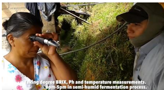
農協スタッフとチェリーの糖度を確認する農園主