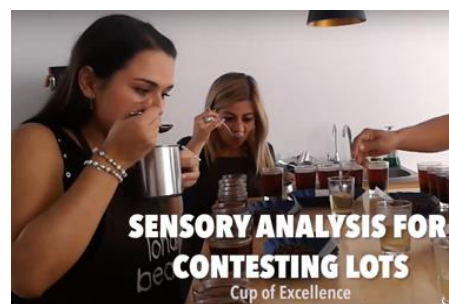
弊社ボゴタオフィスで厳選なカップングを行う